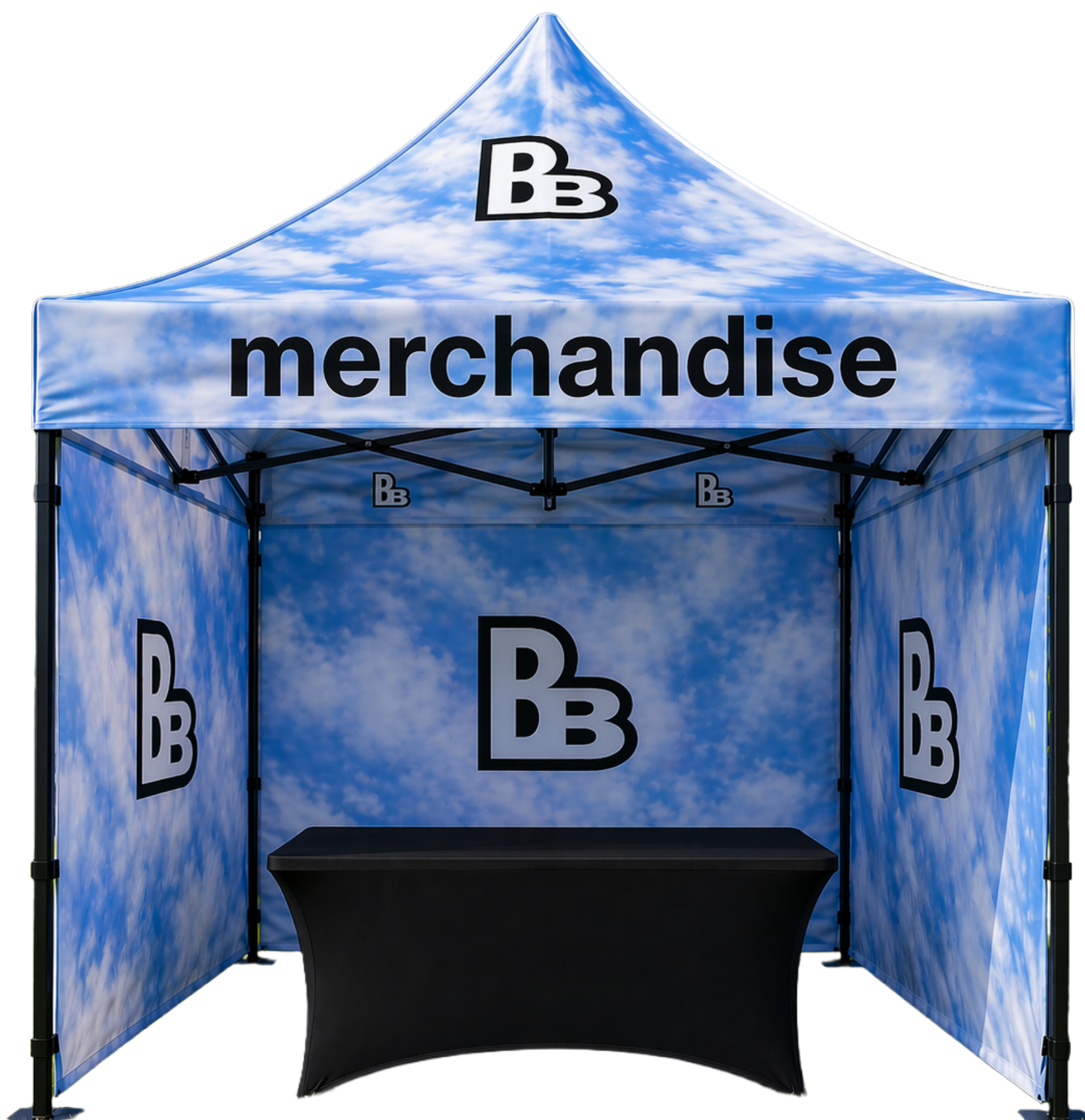
Vizualizácia MERCH stánku

Kapela si vyhradzuje právo na celý zisk z predaja svojho tovaru.